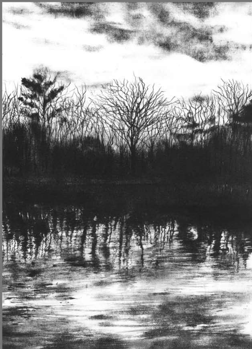
1. Kasterlee Litho